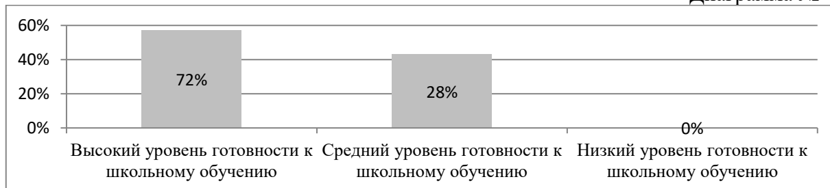
Диаграмма № 4

Воспитанники подготовительных к школе групп принимали участие в образовательных мероприятиях и имеют определенные успехи.