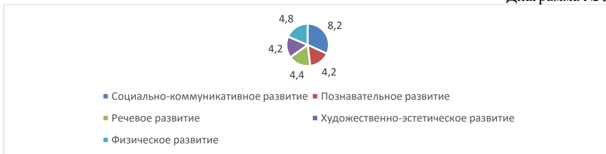
Диаграмма № 3

Педагогическая диагностика проведена педагогическими работниками в форме наблюдений за воспитанниками по технологии Верещагиной Н.В. Значения от 3.8 баллов до 5 баллов указывают на нормативные варианты развития воспитанников.